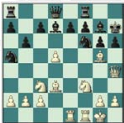
#95. Juegan las blancas.