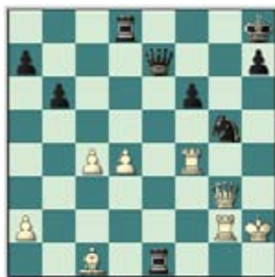
#80. Juegan las blancas.