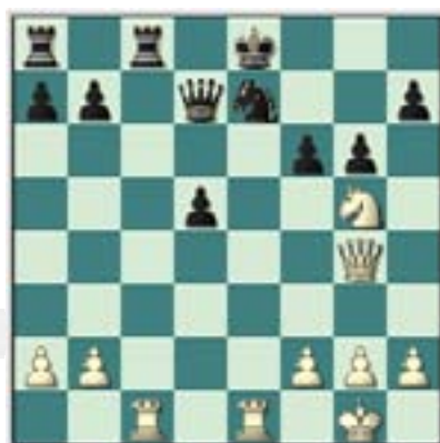
#106. Juegan las blancas.