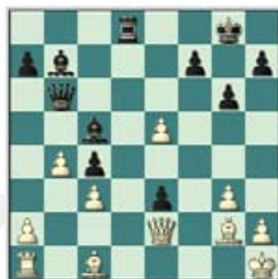
#70. Juegan las negras.