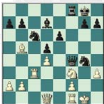
#71. Juegan las negras.