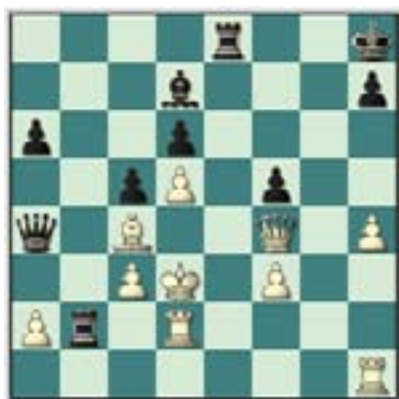
#67. Juegan las negras.