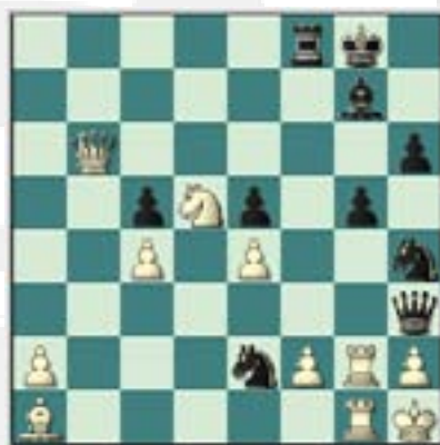
#64. Juegan las negras.