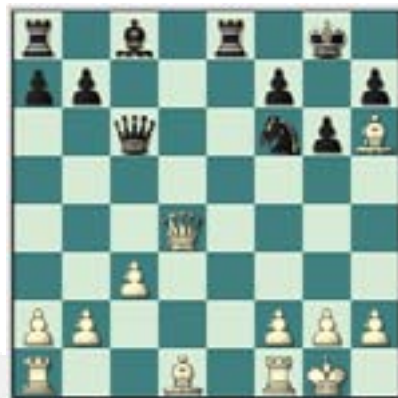
#78. Juegan las blancas.