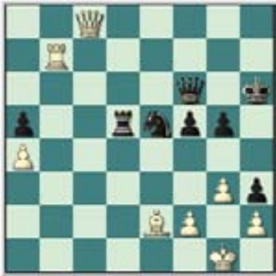
#71. Juegan las negras.