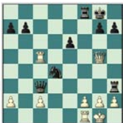
#61. Juegan las negras.