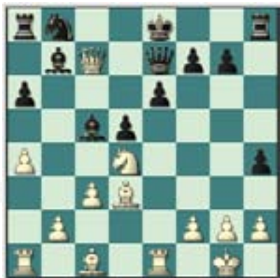
#77. Juegan las blancas.