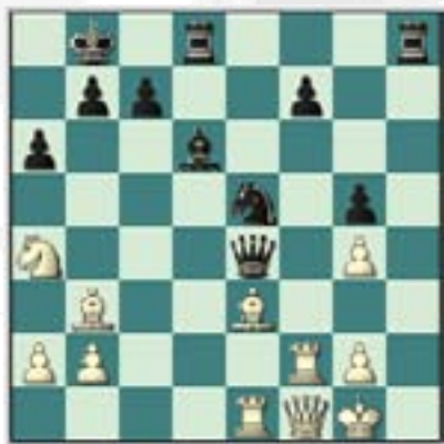
#79. Juegan las negras.