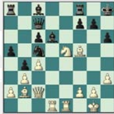
#88. Juegan las blancas.