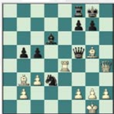
#63. Juegan las negras.