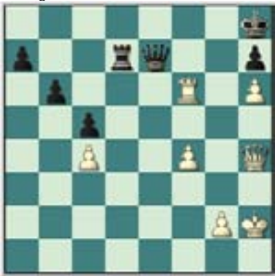
#49. Juegan las blancas.