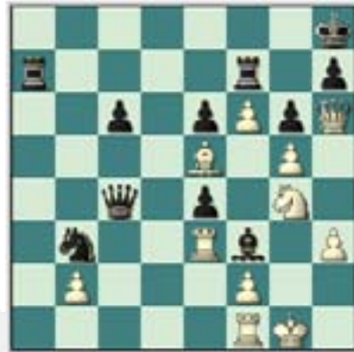
#86. Juegan las negras.