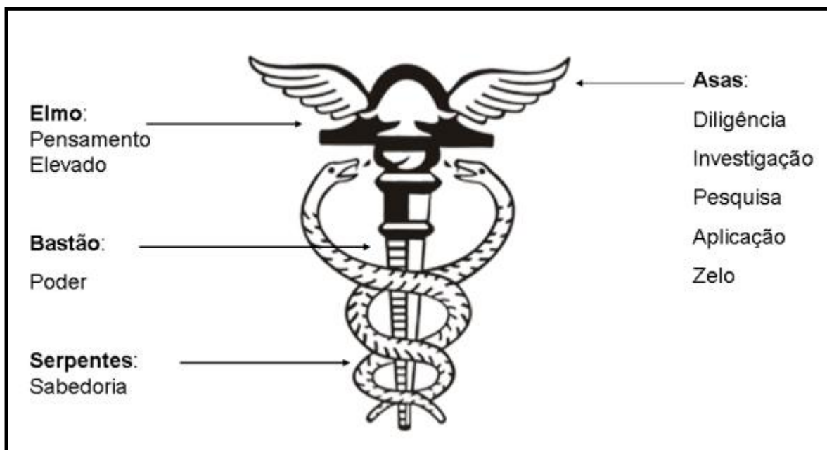
Figura 01: Símbolo da Contabilidade e sua descrição.