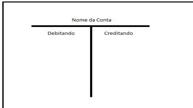
Figura 04 : Representação do Razonete.

Sendo assim, de um lado do razonete registram-se os aumentos e do outro as diminuições. A natureza da conta é que determina que lado deva ser utilizado para aumentos e que lado deve ser utilizado para diminuições.